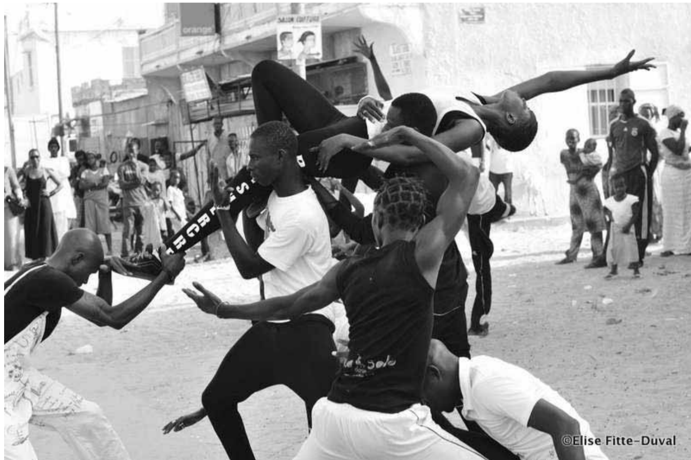
Spectacle d'ouverture dans les rues de Santhiaba par des jeunes talents Sénégalais. Juin 2012

Créer un festival annuel de danse contemporaine à Saint-Louis du Sénégal, un nouveau tremplin pour les talents nationaux et internationaux, dans un temps court et avec des moyens limités: tel était le défi que la Compagnie Diagn'Art et l'Institut Français de Saint-Louis s'étaient donné en 2008.